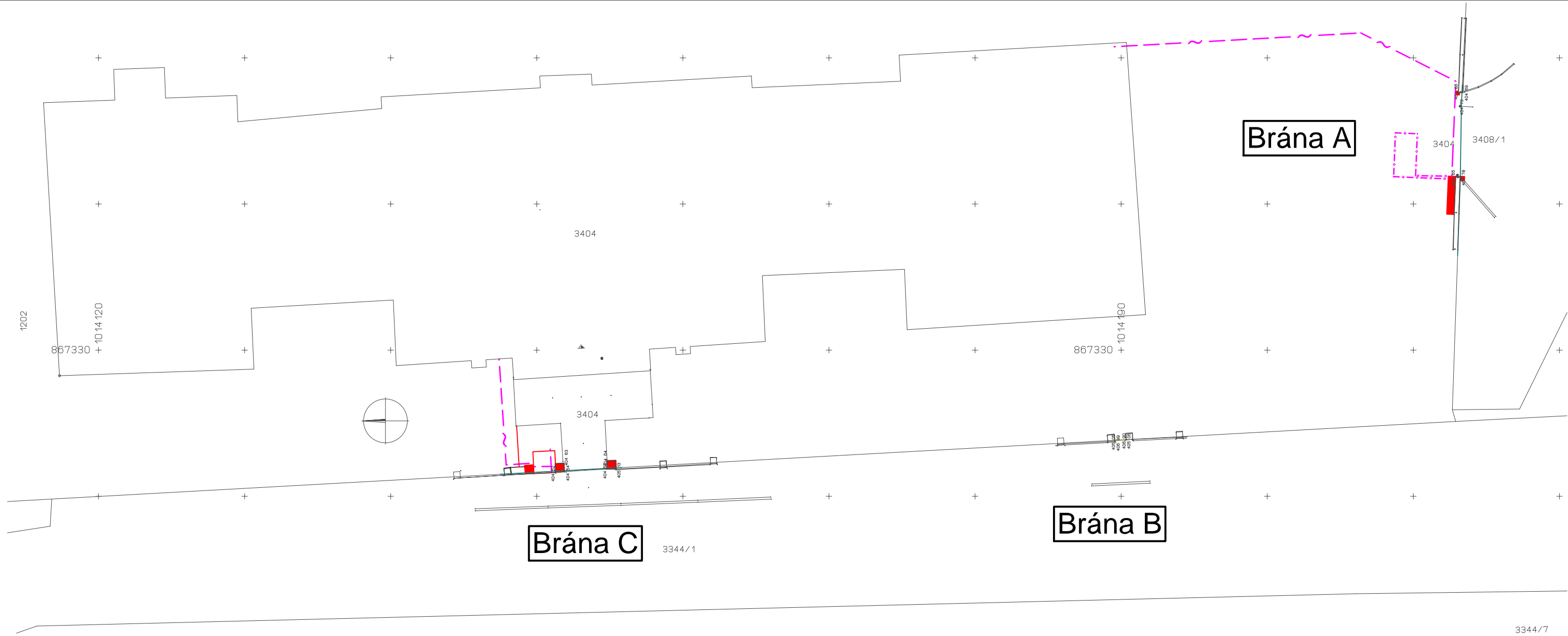
Brána A - katastr ( 1:50 )